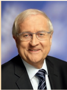
Rainer Brüderle Bundesminister für Wirtschaft und Technologie